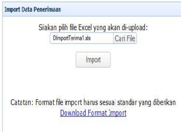
Gambar 9. Tampilan Form Import Penerimaan

menu Import Data. Kemudian memilih file excel yang akan di-import, lalu klik tombol Import. Gambar 9 menunjukkan tampilan form import penerimaan.