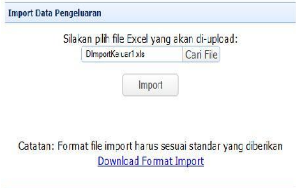
Gambar 15. Tampilan Form Import Pengeluaran

Source code tersebut melakukan aksi penyimpanan dalam tabel Ibapb2 , Ibtb , Ibbph , dan Isemestert , serta otomatis menambah stok di tabel Stokbarang . Tampilan form import pengeluaran dapat dilihat pada Gambar 15.