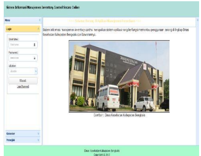
Gambar 7. Halaman Utama Sistem Informasi

Penelitian ini menghasilkan sistem informasi manajemen inventory control yang menghubungkan Dinas Kesehatan dan UPTD Kesehatan di wilayah Kabupaten Bengkalis menggunakan bahasa pemrograman PHP dan database MySQL. Sistem informasi ini menghasilkan keluaran berupa laporan yang meliputi Berita Acara Penerimaan Barang, Buku Penerimaan, Buku Barang Pakai Habis, Kartu Persediaan, Surat Permintaan, Surat Perintah Pengeluaran, hingga Laporan Semester Penerimaan dan Pengeluaran Barang. Selain itu, sistem informasi ini dapat menampilkan informasi stok secara real-time di masing-masing pihak terkait setelah terdapat penerimaan atau pengeluaran barang. Sistem informasi terdiri dari beberapa pembagian hak akses, yaitu Penyimpan Barang, UPTD Kesehatan per kecamatan dan Kasubag. Halaman utama sistem ditunjukkan pada Gambar 7.