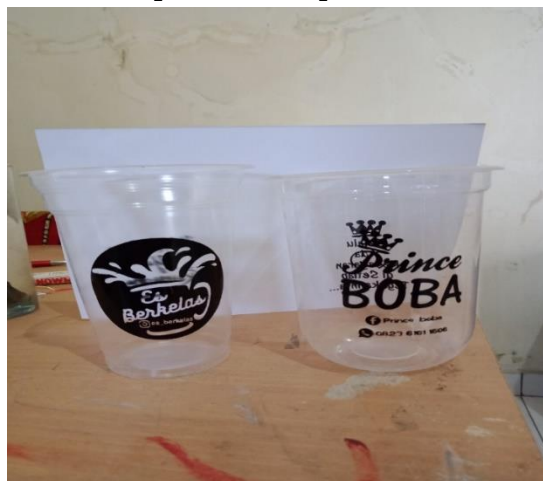
Gambar 1. Sablon Cup Minuman

Kelompok usaha sablon Sanjaya Production merupakan salah satu industri rumahan yang bergerak dibidang jasa sablon untuk berbagai jenis benda mulai cup minuman, kantong plastik, stiker, kaos, payung, bendera, dan sablon souvenir lainnya. Salah satu hasil produk dari usaha sablon Sanjaya Production dapat dilihat pada Gambar 1.