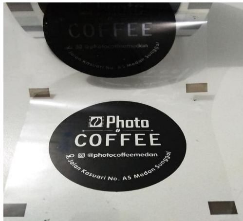
Gambar 2. Plastik Lid Sealer

Untuk memperluas dan memperkuat merk dari pemesan, biasanya mereka ingin menyablon cup minuman sekaligus dengan lid sealer (penutupnya). Namun terdapat kendala untuk bisa menyediakan jasa sablon tersebut karena belum adanya peralatan untuk menyablon lid sealer. Pengerjaan untuk jasa sablon lid sealer tanpa alat sablon lid sealer agak sulit dikerjakan karena panjangnya gulungan plastik sealer sampai 100 m. Jika gulungan plastik sealer tidak tersusun rapi maka akan mempengaruhi kualitas sablonnya. Berikut ini merupakan bentuk dari lid sealer seperti yang terlihat pada Gambar 2.