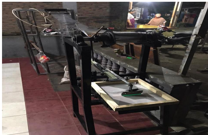
Gambar 4. Alat Sablon Lid Sealer

Tim PKM membuat rancang bangun alat sablon lid sealer berbahan besi dengan bobot 200 kg. Berikut ini hasil rancang bangun dari alat sablon lid sealer tersebut seperti yang terlihat pada Gambar 4.