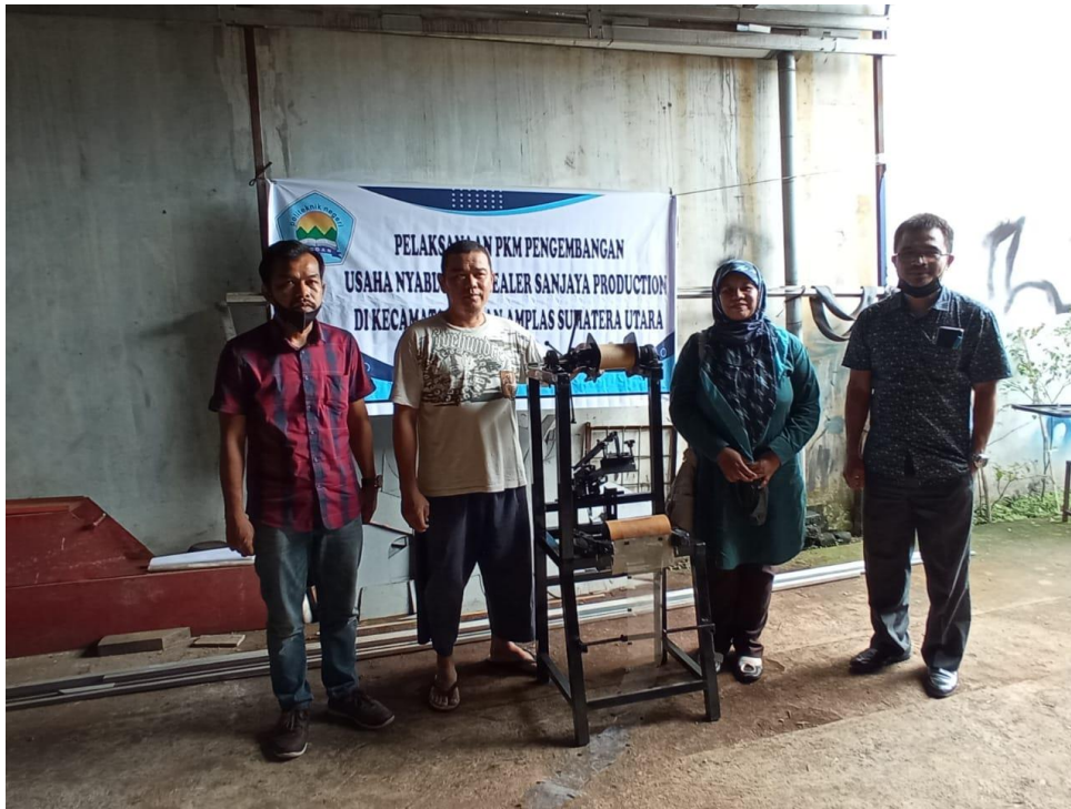
Gambar 5. Serah Terima Alat Sablon Lid Sealer