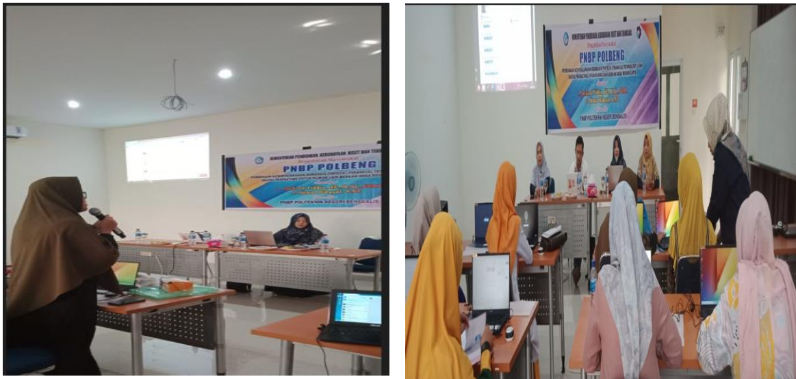
Gambar 3. Kegiatan Pelatihan Digital Marketing di ruang Jurusan Administrasi Niaga Polbeng, 2022