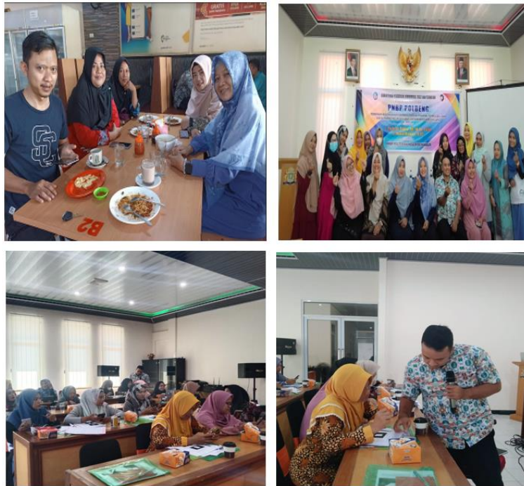
Gambar 2. Kegiatan Pelatihan Financial Technology (Fintech) di Aula Kantor Kadin Bengkalis, 2022