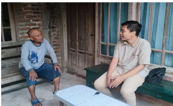
Gambar 1.3 Menggali Permasalahan dan Informasi Mitra