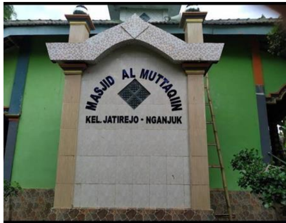
Gambar 1.2 Masjid Al Muttaqin

Running Text telah banyak digunakan di berbagai tempat, termasuk perusahaan, kantor, gedung pencakar langit, dan bahkan sekolah dan tempat ibadah, dan Running Text telah digunakan untuk memberikan informasi yang jelas dan menarik.