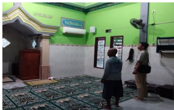
Gambar 1.4 Observasi Lapangan Mitra