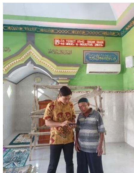
Gambar 3.4 Sosialisasi Tentang Penggunaan Aplikasi Running Text

Setelah pemesanan running text sesuai dengan ukuran yang digunakan dan pemilihan tempat yang sesuai untuk tempat hardware pada bangunan masjid, dilakukan pemasangan seperti pada gambar 5.2. Setelah pemasangan selesai dilakukan, berikutnya yaitu pengecekan fungsi running text melalui aplikasi dengan menginstall aplikasi terlebih dahulu.