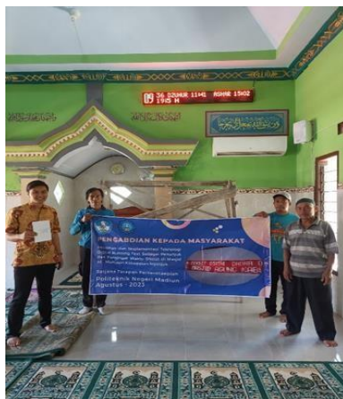
Gambar 3.5 Penyerahan Running Text Kepada Pengurus Masjid

Berdasarkan hasil kegiatan pengabdian kepada masyarakat di Pengurus Masjid Al Muttaqin di Jl. Jumpang No.8, Jatirejo, Kec. Nganjuk, Kabupaten Nganjuk, Jawa Timur, menunjukkan bahwa output program pelatihan yang telah dilaksanakan sesuai dengan target yang ducapai. Program pengabdian terlaksana melalui bentuk kerjasama dengan Pengurus Masjid Al Muttaqin, Jatirejo kecamatan Nganjuk kabupaten Nganjuk sebagai wujud kepedulian dan transfer knowledge ke masyarakat ini. Ini ditunjukkan dengan meningkatnya kemampuan Pengurus Masjid Al Muttaqin terkait penguasaan materi dari proses penyampaian materi teori dan praktik terkait install aplikasi dan penggunaan aplikasi.