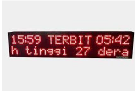
Gambar 1.1 Contoh Papan Running Text

Running Text telah banyak digunakan di berbagai tempat, termasuk perusahaan, kantor, gedung pencakar langit, dan bahkan sekolah dan tempat ibadah, dan Running Text telah digunakan untuk memberikan informasi yang jelas dan menarik.