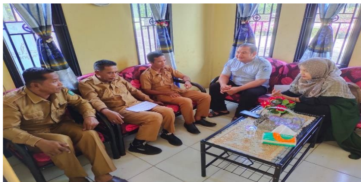
Gambar 2. Diskusi dengan Perangkat Desa Muntai