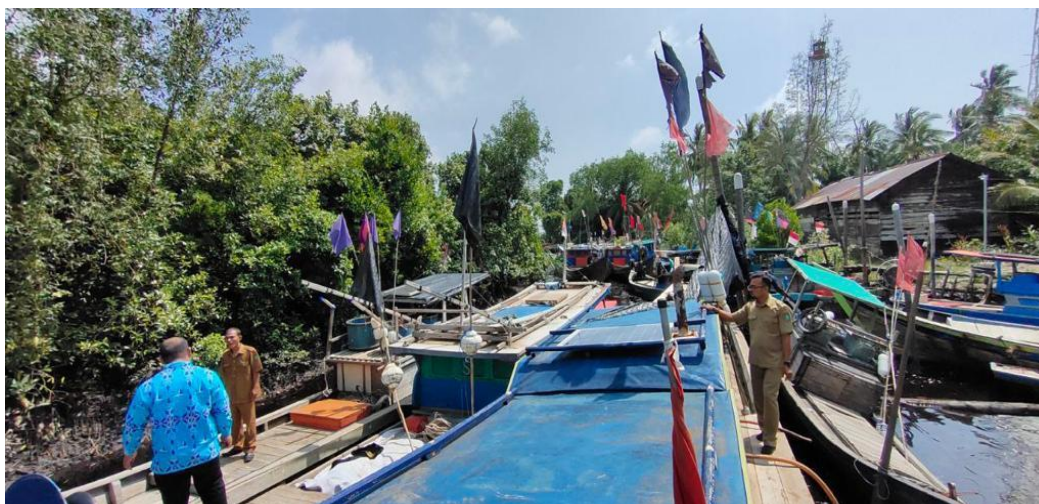
Gambar 1. Tim pengabdian survey kapal nelayan traditional Muntai

Bengkalis merupakan Salah satu kabupaten di Indonesia yang berbentuk pulau dikelilingi laut. Salah satu desa di kecamatan Bengkalis yang sedang dalam masa pengembangan untuk menjadi desa percontohan adalah desa Muntai. Berdasarkan data statistic Dari pemerintah desa Muntai pekerjaan masyarakat setempat antara lain petani dan nelayan. Sebagai tenaga pendidik di Jurusan Kemaritiman yang berlokasi di desa Muntai, Tim melakukan survey terhadap keselamatan pelayaran kepada nelayan--nelayan traditional yang ada didaerah tersebut,, yang notabene melakukan penarian ikan di laut masih dengan caracara traditional dengan menggunakan alat penangkap ikan sederhana dan tanpa alat keselamatan yang berarti pada saat melakukan pekerjaan mereka. Dikarenakan kurangnya kesadaran dan kurang memadainya kualitas serta keterampilan pekerja sehingga banyak awak kapal yang meremehkan tentang risiko bekerja, seperti tidak menggunakan alat-alat keselamatan secara memadai dan benar.