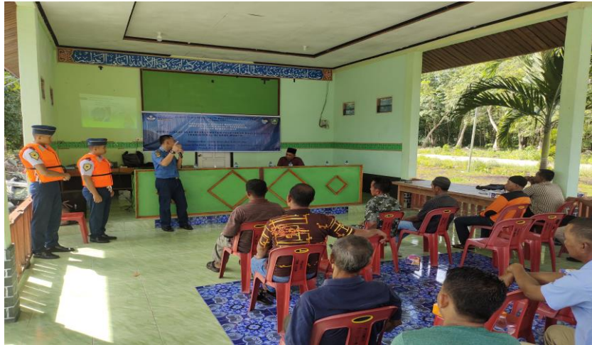
Gambar 3. Kegiatan tinjauan dan sosialisasi penggunaan alat