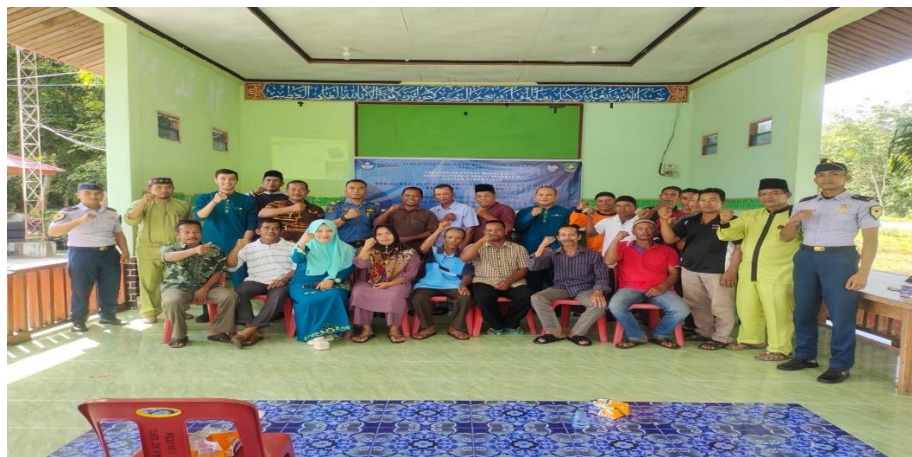
Gambar 4. Foto Bersama setelah kegiatan berlangsung